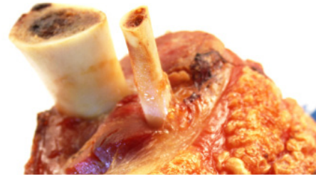
Mini-Haxe vorgegart, nur noch im Backofen oder Microwelle erwärmen, mit Biersoße St. 5,90