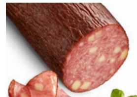
Tiroler Kochsalami mit Käse, hausgemachte, deftige Brotzeitwurst kg 23,99