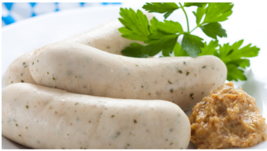
hausgemachte Weißwürstel kg 17,99