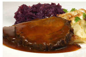
hausgemachter Sauerbraten fix und fertig mit Sauce kg 32,99